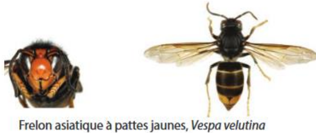
Frelon asiatique à pattes jaunes, Vespa velutina

Le frelon est reconnaissable car il est majoritairement noir, avec une large bande orange sur l'abdomen et un liseré jaune sur le premier segment. Sa tête vue de face est orange, et les pattes sont jaunes aux extrémités. Il mesure entre 17 et 32mm.