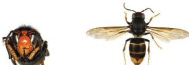
Frelon asiatique à pattes jaunes, Vespa velutina

Le frelon est reconnaissable car il est majoritairement noir, avec une large bande orange sur l'abdomen et un liseré jaune sur le premier segment. Sa tête vue de face est orange, et les pattes sont jaunes aux extrémités. Il mesure entre 17 et 32mm.