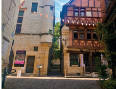
Maisons médiévales du Grand Carroi de Chinon