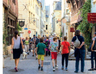
Visite du centre historique de Chinon