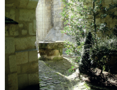
Impasse de la Poterne à Chinon