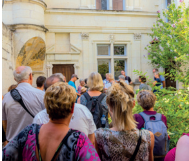
Visite d'une cour privée lors des Journées du Patrimoine

► Départ de la Fontaine des Trois Grâces, place du Général de Gaulle, Chinon