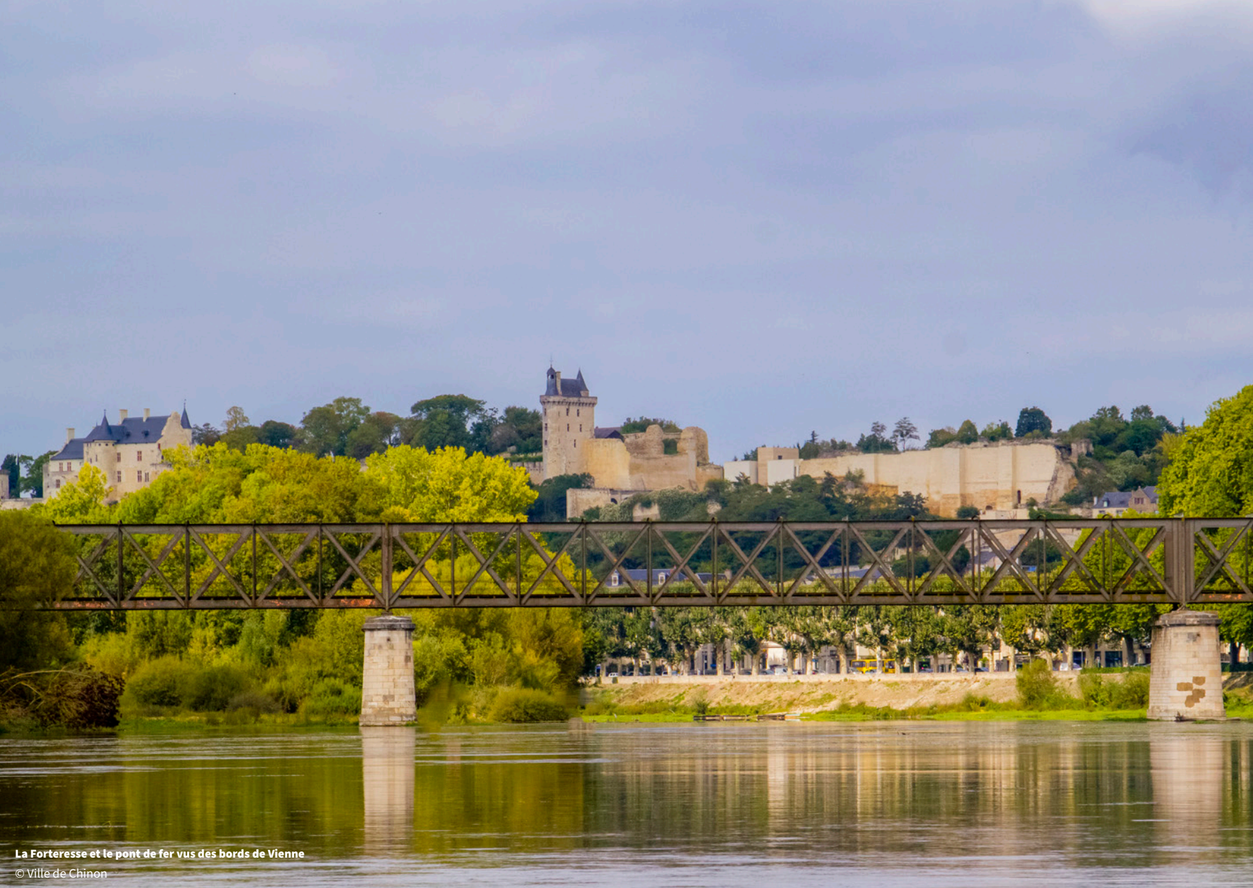
La Forteresse et le pont de fer vus des bords de Vienne