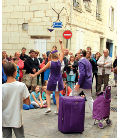
La Vit'visite