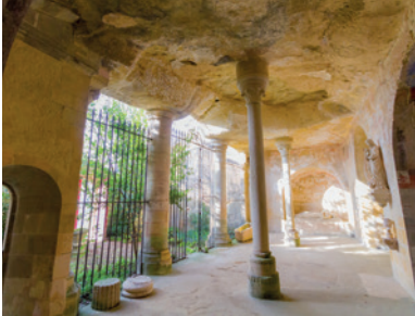
Chapelle Sainte-Radegonde