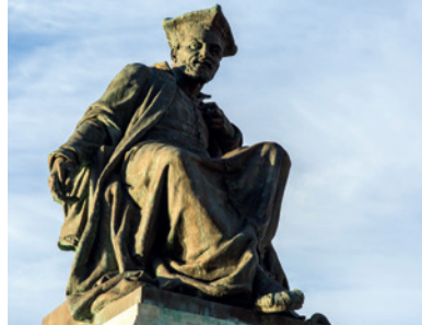
Emile Hébert, Statue de Rabelais, 1881, bronze,