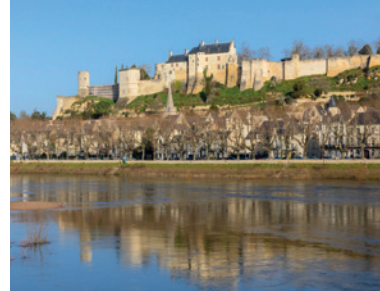
Forteresse Royale de Chinon