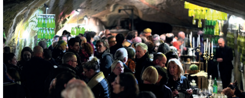
Grand banquet aux Caves Painctes lors des Nourritures Élémentaires