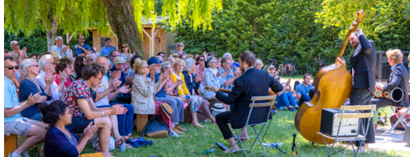
Concert du festival Chinon en Jazz

Pour plus d'informations : 02 47 93 04 92, culture@ville-chinon.com , ville-chinon.com