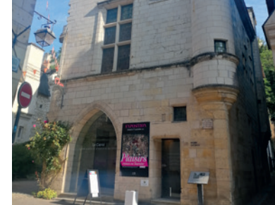
Le Carroi, musée d'arts et d'histoire

Pour toutes les informations sur la programmation, consultez le site internet de la Forteresse : forteressechinon.fr/