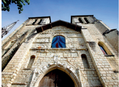
Façade occidentale de l'ancienne collégiale Saint-Mexme