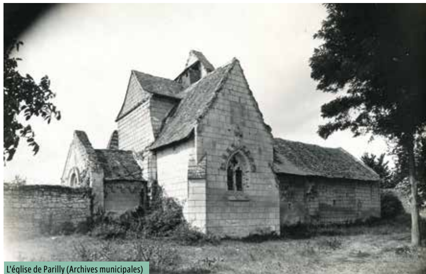
L'église de Parilly

Classé aux Monuments historiques depuis 1928, l'édifice du sud chinonais se présente comme un témoignage majeur de l'art roman en Touraine.