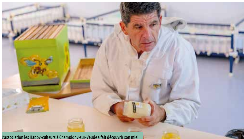
L'association les Happy-culteurs à Champigny-sur-Veude a fait découvrir son miel