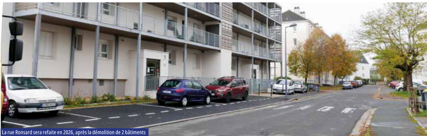
La rue Ronsard sera refaite en 2026, après la démolition de 2 bâtiments