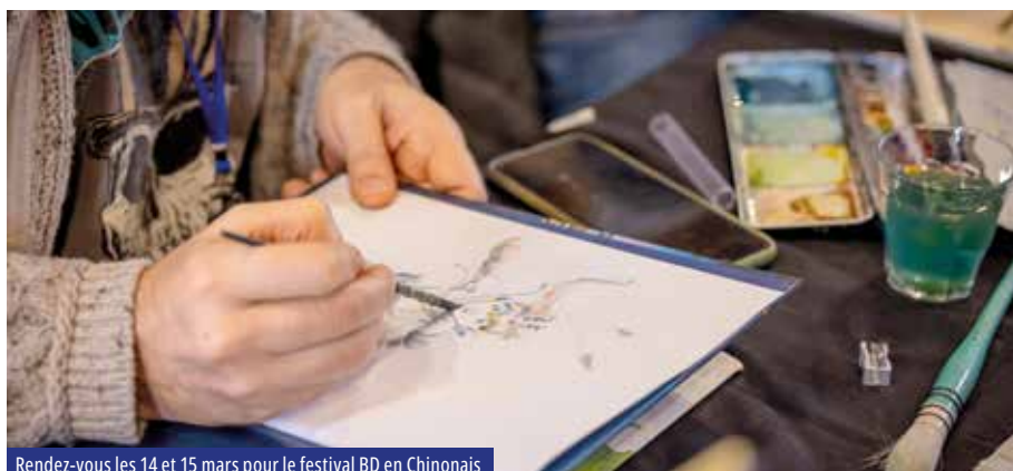
Rendez-vous les 14 et 15 mars pour le festival BD en Chinonais

Tarif unique : 12 € (buvette et foodtrucks sur place). Billetterie : chinon.festik.net (prévoir une commission de 0,80 €), Azay-Chinon Val de Loire Tourisme. Renseignements : service culturel au 02 47 93 04 92, ville-chinon.com , assoroc.chinon@gmail.com