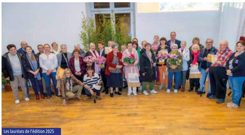
Les lauréats de l'édition 2025