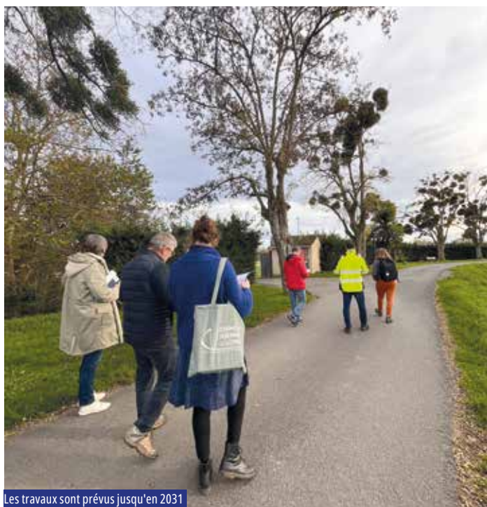
Les travaux sont prévus jusqu'en 2031

L'année prochaine, l'opération prévoit aussi la démolition de 2 bâtiments, soit 24 logements, implantés de part et d'autre de la rue Ronsard. Une fois ces deux ensembles supprimés, la municipalité lancera la remise en état de la rue et de l'impasse Ronsard, 2 voiries dégradées.