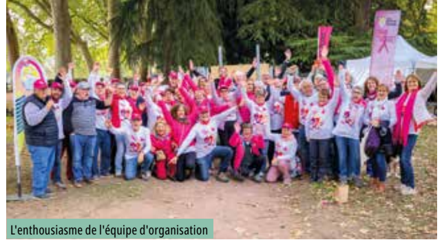
L'enthousiasme de l'équipe d'organisation

Tous en rose ! Le mot d'ordre lancé par l'association Action sport santé nutrition (ASSN) et ses 150 bénévoles a fédéré de nombreux habitants et plusieurs associations locales samedi 4 et dimanche 5 octobre derniers. Cette opération visant à sensibiliser le grand public et à mettre en place des actions pour les personnes atteintes d'un cancer du sein a attiré près de 800 personnes.