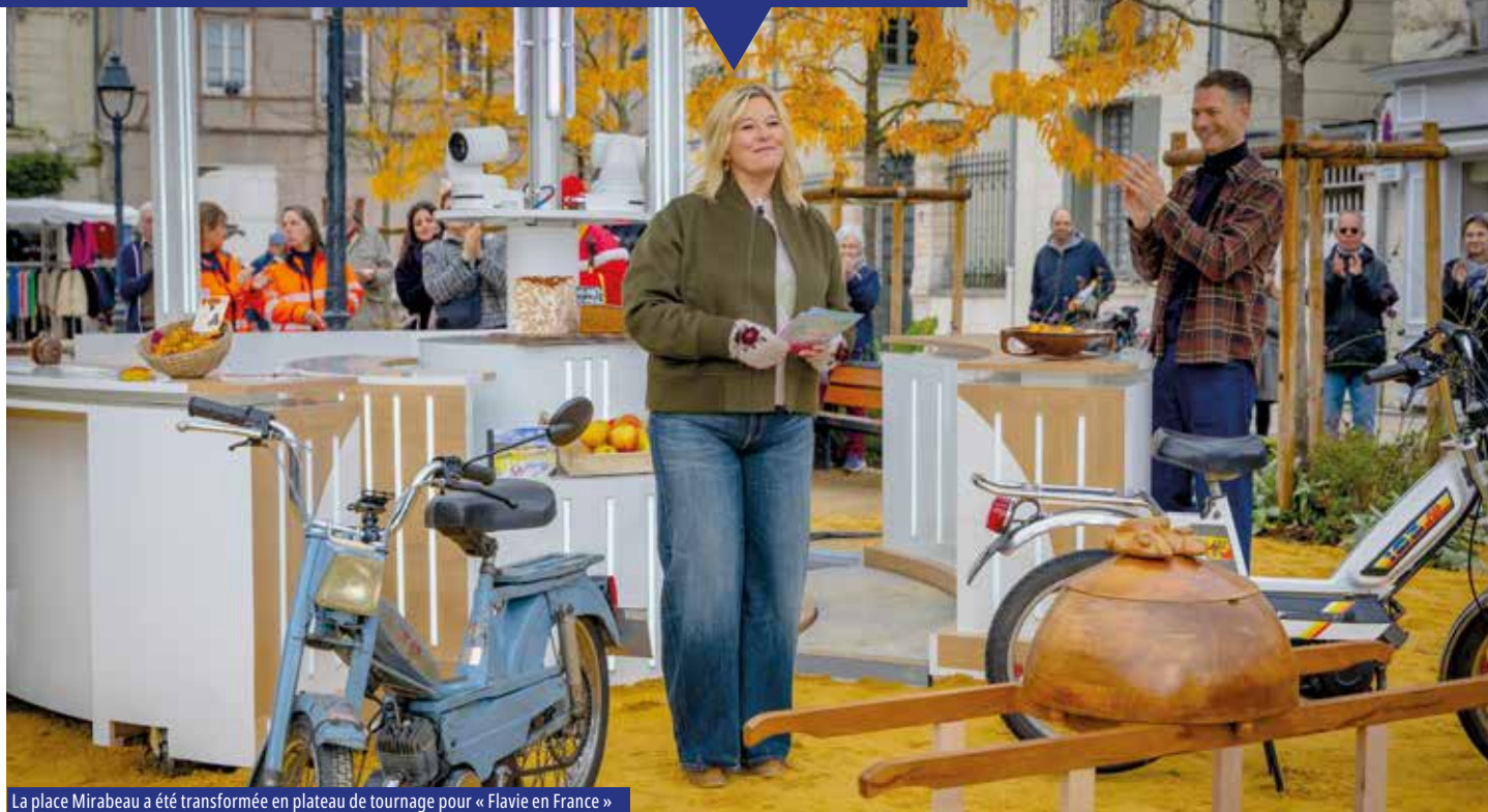
La place Mirabeau a été transformée en plateau de tournage pour « Flavie en France »