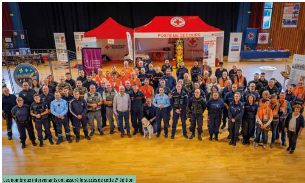
Les nombreux intervenants ont assuré le succès de cette 2 e édition