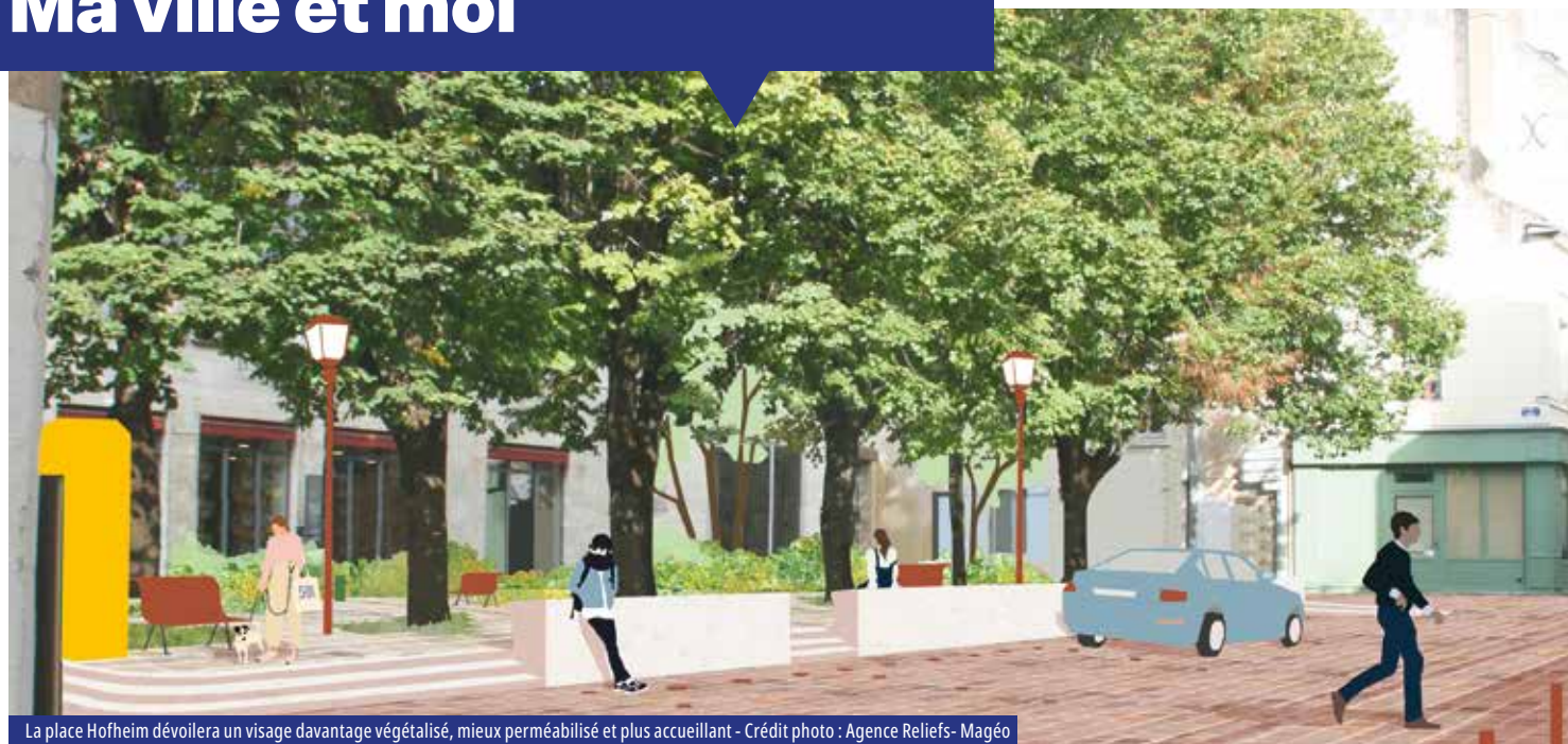
La place Hofheim dévoilera un visage davantage végétalisé, mieux perméabilisé et plus accueillant