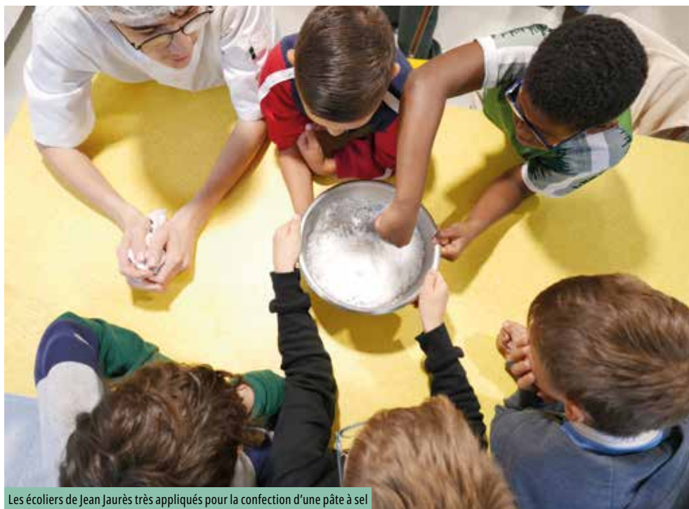
Les écoliers de Jean Jaurès très appliqués pour la confection d'une pâte à sel