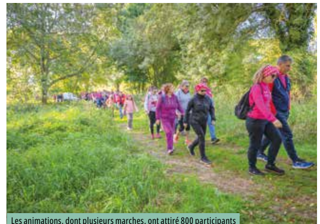
Les animations, dont plusieurs marches, ont attiré 800 participants

sportsantenutrition.fr/accompagnement-du-cancer