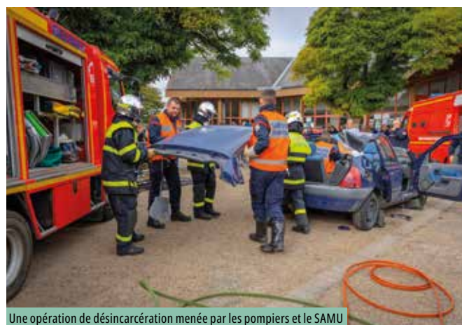
Une opération de désincarcération menée par les pompiers et le SAMU