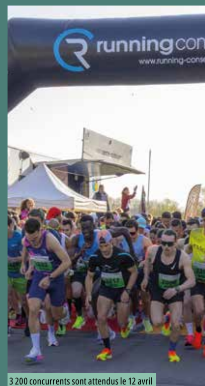
3 200 concurrents sont attendus le 12 avril