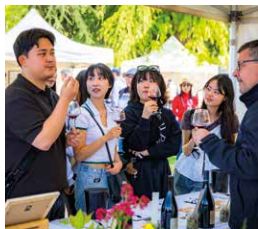
25 avril Du vin et de la bonne humeur pour la 17 e édition des Vignerons dans la ville.