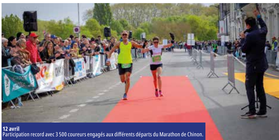
12 avril Participation record avec 3 500 coureurs engagés aux différents départs du Marathon de Chinon.