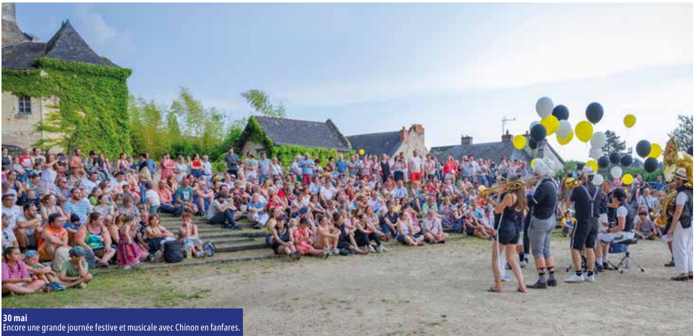
30 mai Encore une grande journée festive et musicale avec Chinon en fanfares.