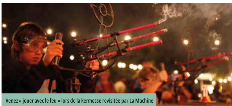
Venez « jouer avec le feu » lors de la kermesse revisitée par La Machine