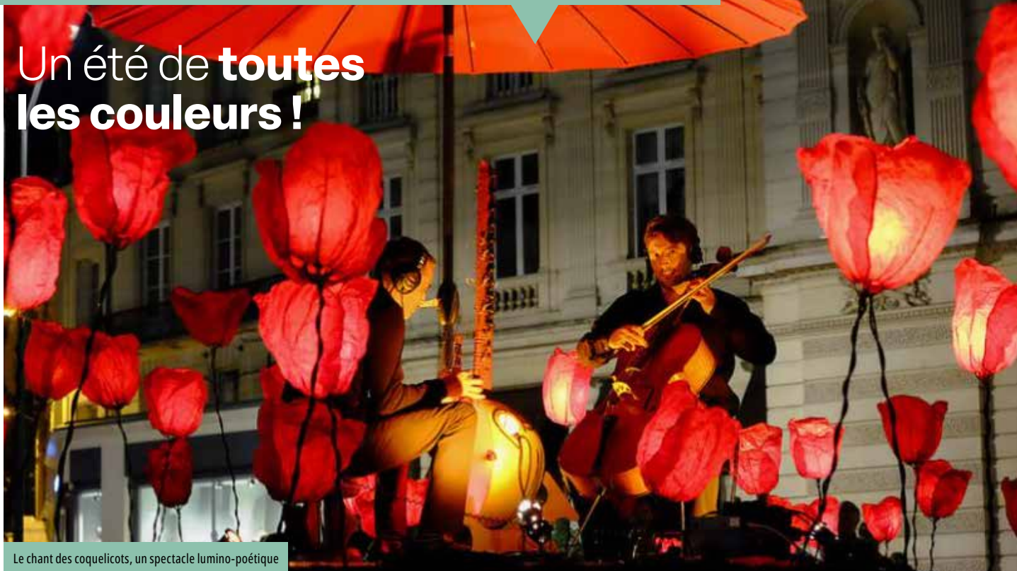
Le chant des coquelicots, un spectacle lumino-poétique