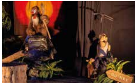
Le spectacle de marionnettes « Les singes », par la Cie Bitonio, à découvrir le 15 juillet.

- À 15h : spectacle de marionnettes « Les singes » par la Cie Bitonio.