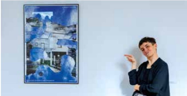
Du 8 au 31 mai Expositions, ateliers et rencontres ont rythmé la Fête de l'estampe et de la microédition.