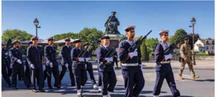
8 mai Commémoration du 81 e anniversaire de la victoire du 8 mai 1945 en présence de marins de Tours.