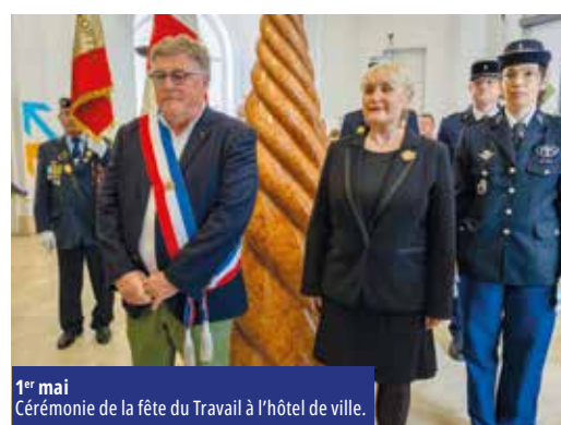
1 er mai Cérémonie de la fête du Travail à l'hôtel de ville.