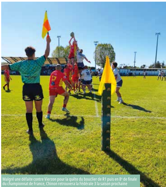
Malgré une défaite contre Vierzon pour la quête du bouclier de R1 puis en 8 e de finale du championnat de France, Chinon retrouvera la Fédérale 3 la saison prochaine

Une accession en Fédérale 3 pour les seniors, un titre pour l'équipe réserve, les féminines sacrées et une place de finaliste pour les juniors : l'année 2025/2026 a été celle de tous les succès pour le SC Chinon.