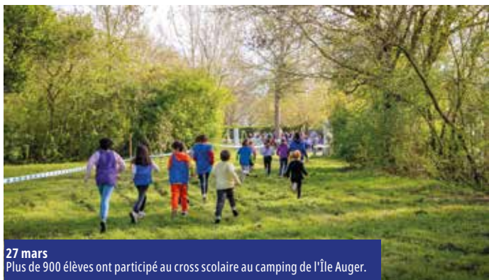
27 mars Plus de 900 élèves ont participé au cross scolaire au camping de l'Île Auger.