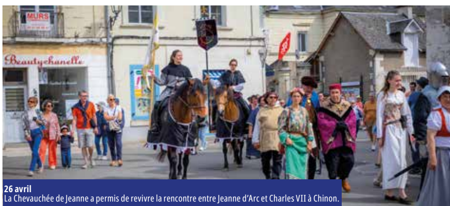
26 avril La Chevauchée de Jeanne a permis de revivre la rencontre entre Jeanne d'Arc et Charles VII à Chinon.