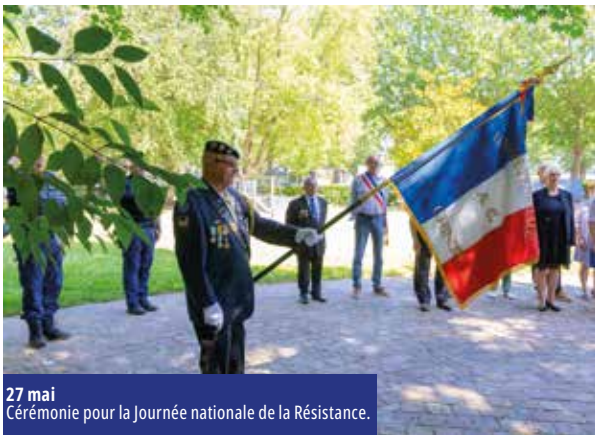
27 mai Cérémonie pour la Journée nationale de la Résistance.