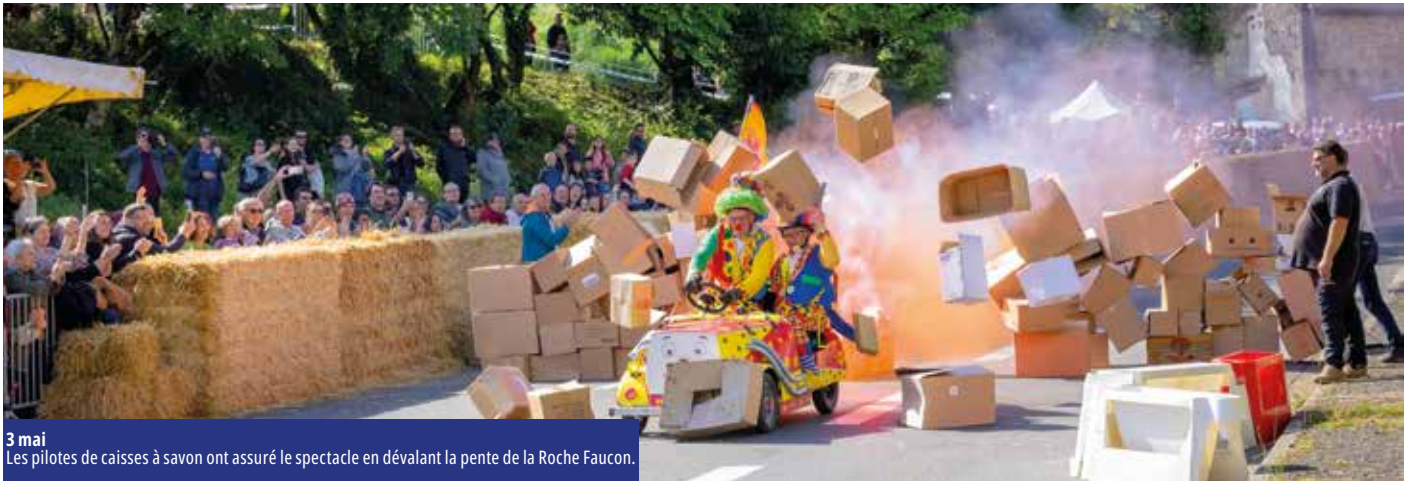
3 mai Les pilotes de caisses à savon ont assuré le spectacle en dévalant la pente de la Roche Faucon.