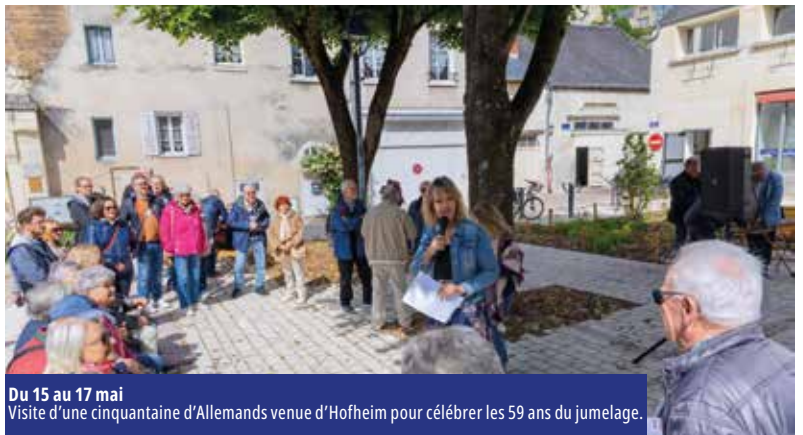
Du 15 au 17 mai Visite d'une cinquantaine d'Allemands venue d'Hofheim pour célébrer les 59 ans du jumelage.