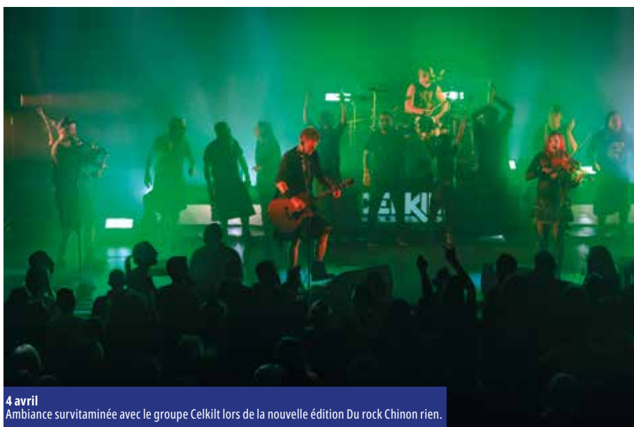
4 avril Ambiance survitaminée avec le groupe Celkilt lors de la nouvelle édition Du rock Chinon rien.