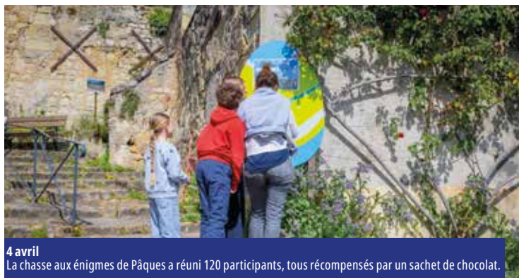
4 avril La chasse aux énigmes de Pâques a réuni 120 participants, tous récompensés par un sachet de chocolat.