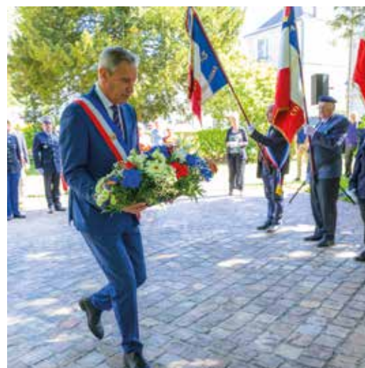
26 avril Cérémonie en mémoire des victimes et héros de la Déportation.