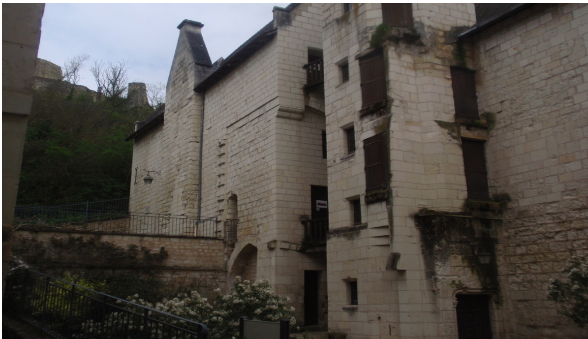
Musée du Carroi